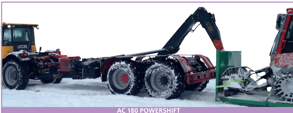
AC 180 POWERSHIFT