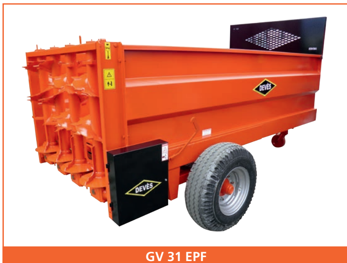
GV 31 EPF