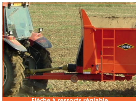
Flèche à ressorts réglable