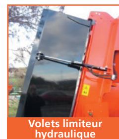
Volets limiteur hydraulique

Toutes nos remorques sont conformes au Code de la Route.