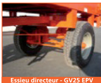
Essieu directeur - GV25 EPV