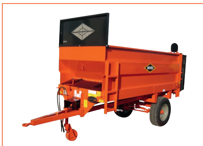
GV 25 EPV