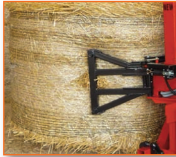
A811 SYN (2 dents) pour balles rondes