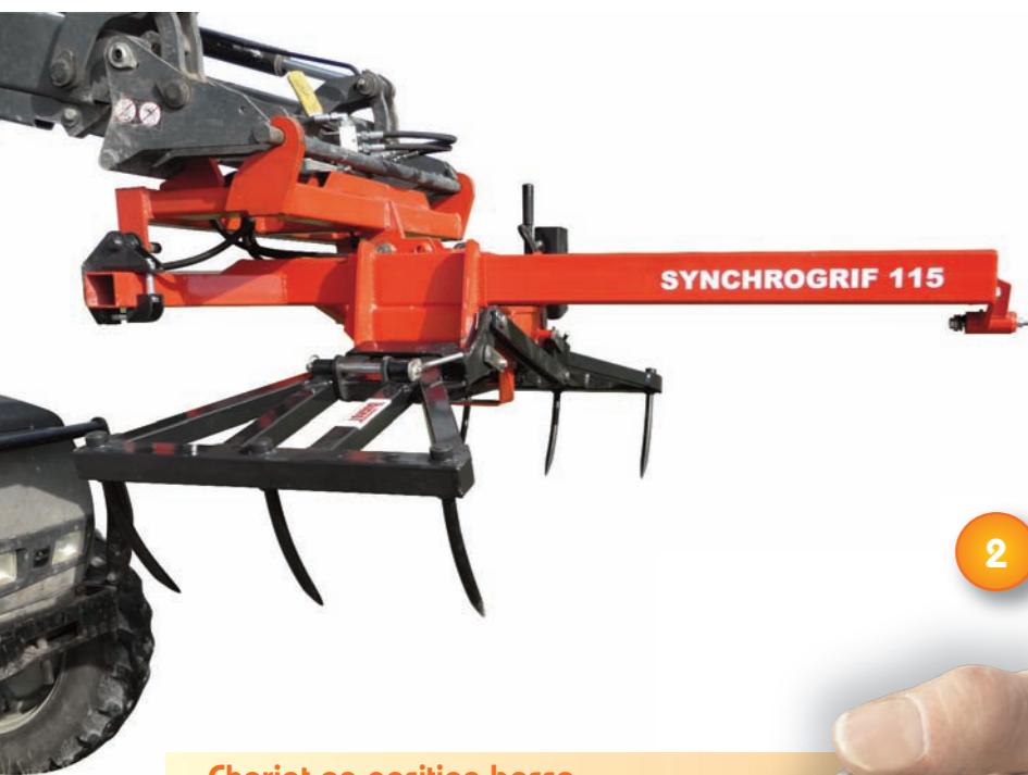
Chariot en position basse