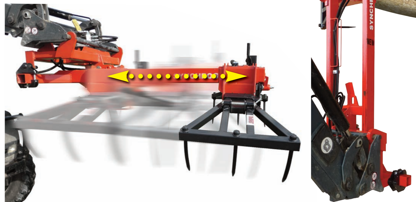
Déplacement du chariot

Ouverture hydraulique des bras depuis le poste de conduite, puis déverrouillage électrique du chariot quand le mat du SYNCHROGRIF 115 est horizontal (Impossible au-delà de 20° vers le haut)