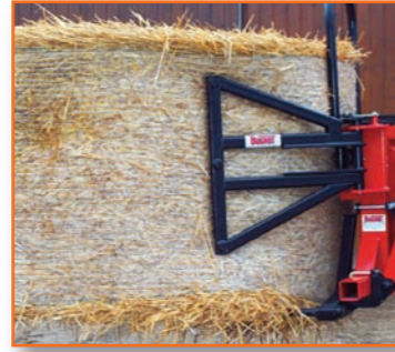
A809 SYN (3 dents) pour balles rondes \text{Ø} > 1,60 \text{ m}