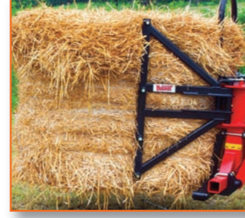
A810 SYN (4 dents) pour balles rondes et rectangulaires