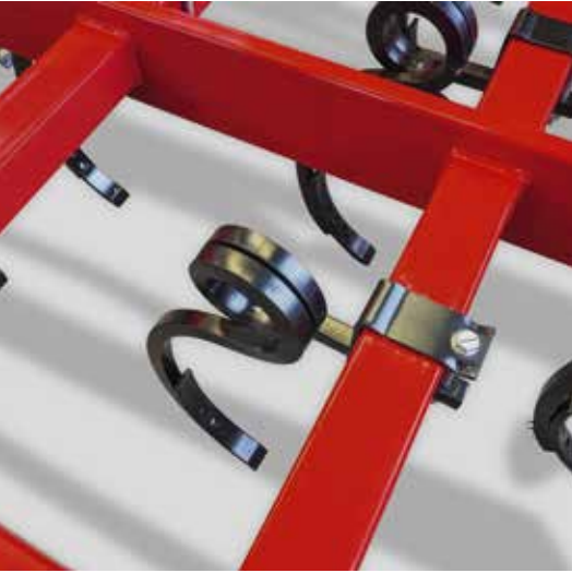
Dent ressort double spire