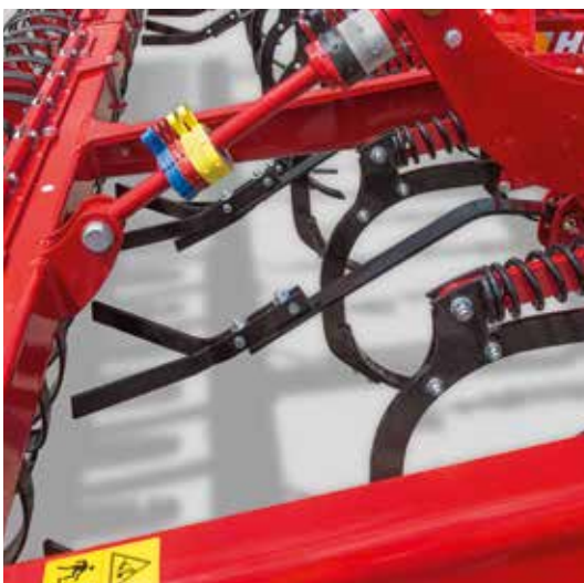
Lames de nivellement