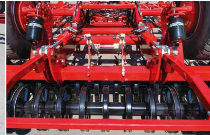
Packer double RollPack