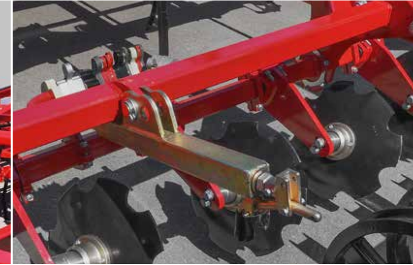
Réglage de profondeur des disques