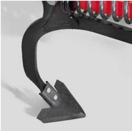
Soc patte d'oie 18 cm