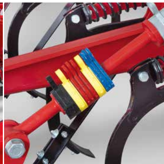
Réglage de la profondeur de travail par des cales alu