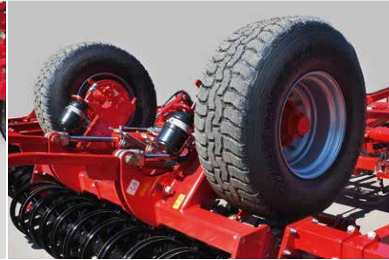
Essieu de transport du Cruiser 12 XL