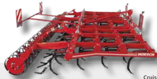
Cruiser 6 XL