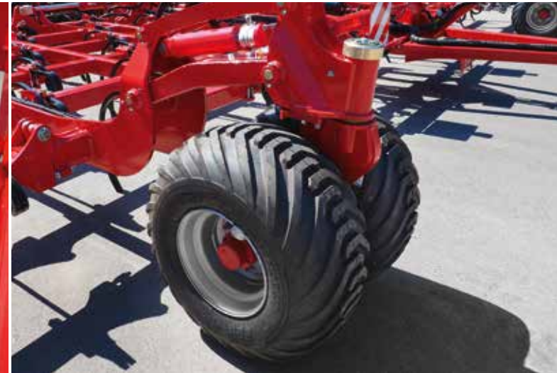
Roues de support frontales