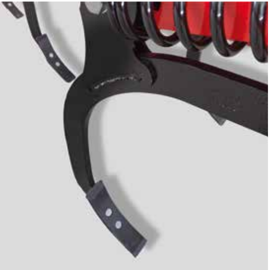
Soc étroit 5 cm