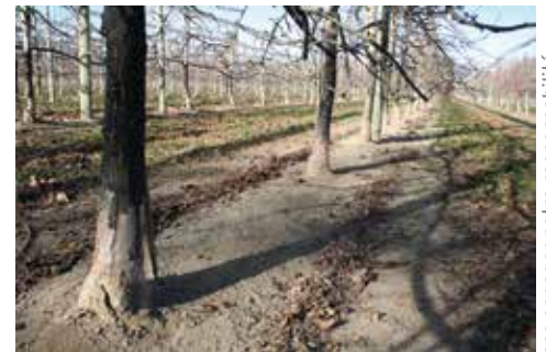
▲ Après passage