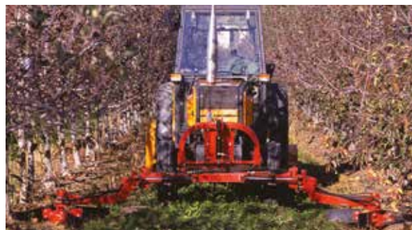
▲ Montage frontal double de l'andaineur rotoram (avec possibilité d'atteler un broyeur à l'arrière).