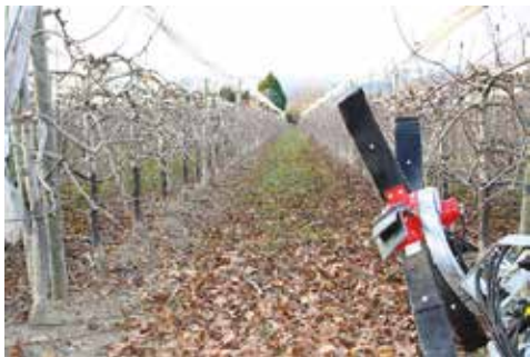
▲ Avant passage

> Exemple du travail de l'andaineur CHABAS dans un verger (avec broyeur CHABAS attelé à l'arrière) :