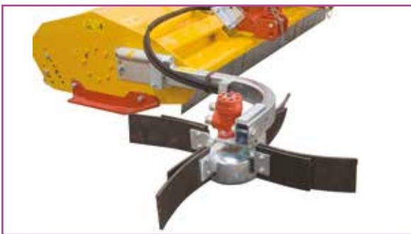
▲ Montage 2 en 1 : Fixation de l'andaineur rotoram