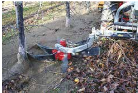
▲ Pendant le travail