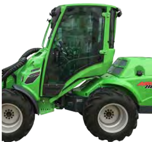
Hauteur avec cabine 2230 mm