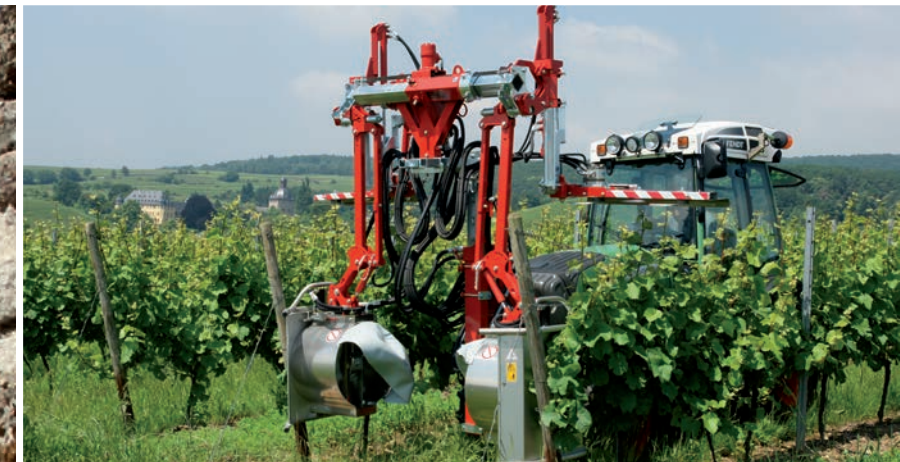
Effeuilleuse bilatérale avec déport pièce de tête et écimeuses hydr.