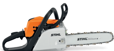
MS 211 TRONÇONNEUSE THERMIQUE

Créées par les ingénieurs de la recherche et développement STIHL et fabriquées dans l'usine suisse de Wil, les nouvelles chaînes .325" PRO offrent une performance de coupe encore accrue, diminuent les vibrations et rendent votre tronçonneuse encore plus confortable.