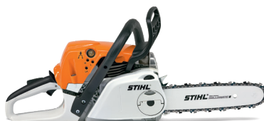
MS 251 C-BE TRONÇONNEUSE THERMIQUE