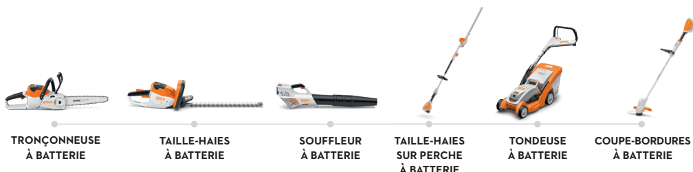
TRONÇONNEUSE À BATTERIE

Avec une seule batterie STIHL, équipez toute votre gamme de matériels.